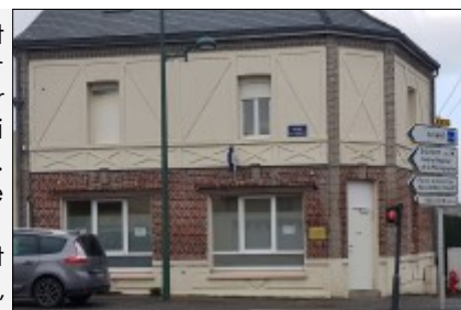
Cabinet de la Pyramide, 525 avenue de l'Europe 59121 Haulchin - tél : 09.51.31.86.10