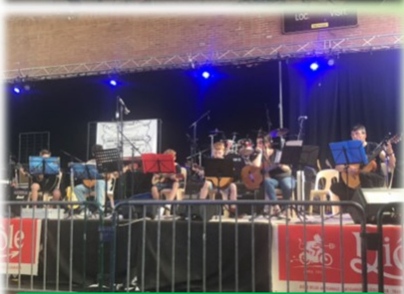
FESTIVAL HAULL'FEST - A.R.M. [18/06/22]